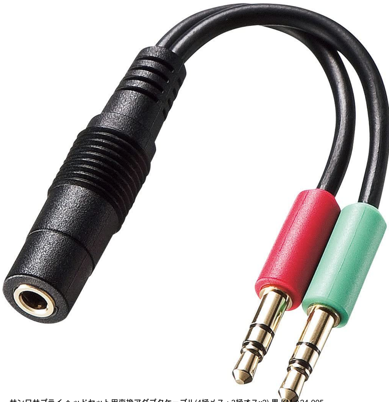
サンワサプライ ヘッドセット用変換アダプタケーブル(4極メス->3極オスx2) 黒 KM-A24-005